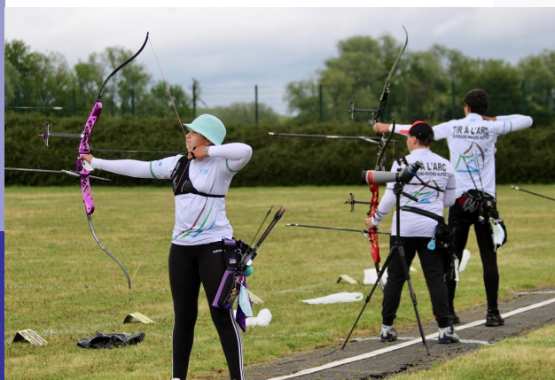
Les archers des groupes jeunes ont récupéré leur tenues